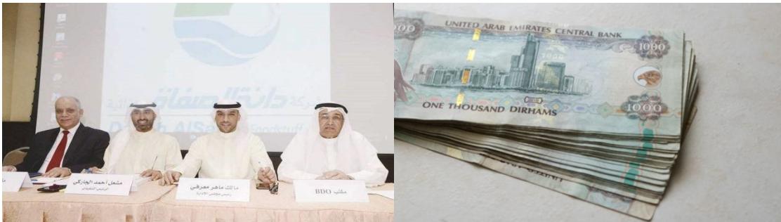
حقق حتى 500 درهم كل 3 أيام . تعلم كيف دانة الصفاة الغذائية (DANAH)